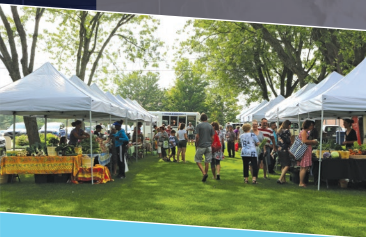
Le Marché public de Valcourt a attiré des centaines de visiteurs chaque semaine au parc Camille-Rouillard et a permis à plus de vingt producteurs d'offrir leurs produits.