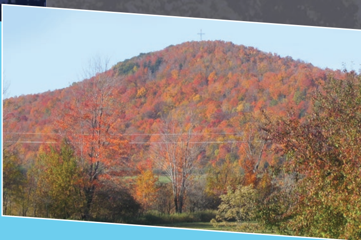
L'étude de potentiel récréotouristique du mont Valcourt sera complétée plus tard en 2019.