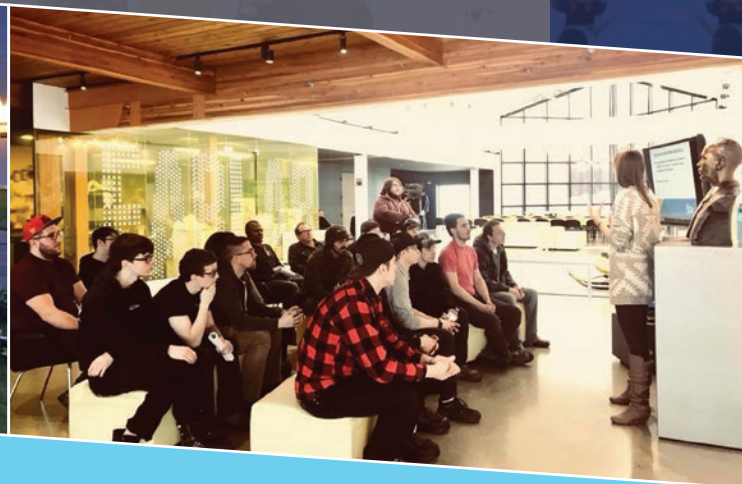
Visite des entreprises du Grand Valcourt pour les étudiants des programmes de formation professionnelle offerts par la Commission scolaire des Sommets.