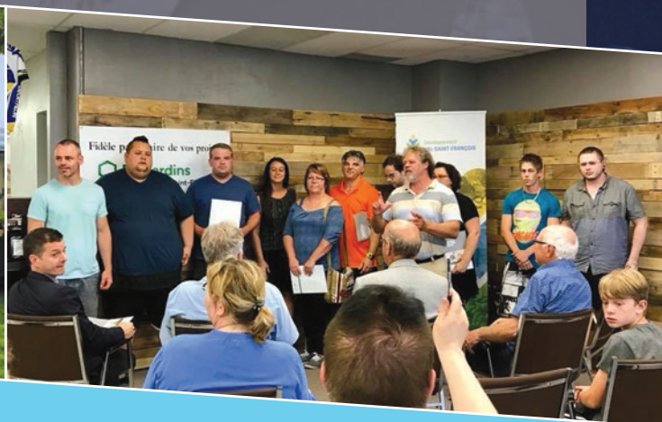
Félicitations à Action Sport Vélo pour leur nouveau point de service à Valcourt! Un plus pour la communauté du Grand Valcourt!