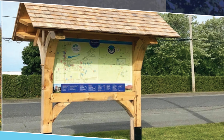
Panneau d'information touristique installé à proximité du parc de VR, au stationnement de l'aréna.