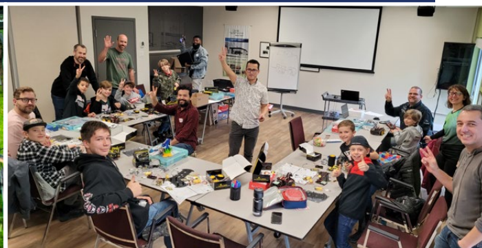
Atelier de robotique