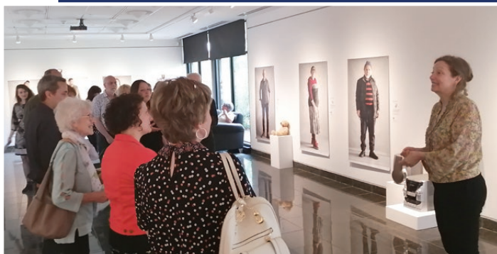
Catalogue des traces

Le Camp Jeunes Leaders vise à initier les jeunes à la gestion de projet locaux. Le but ultime de ce projet est de donner le goût aux jeunes de s'impliquer dans leurs communautés de façon proactive et ainsi devenir des citoyens engagés, le tout sous forme ludique, dans une formule jeu de société accompagnée de différents défis qui favoriseront le travail d'équipe. L'événement s'est tenu du 8 au 10 décembre au Studio B-12 de Valcourt. Sept jeunes ont participé à cette édition.