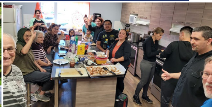
Atelier de cuisine