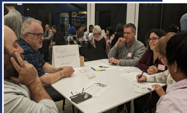
Grand Rendez-Vous édition 2022

Projet photo mettant en vedette 12 personnalités de la région de Valcourt qui témoignent de leur relation avec la nature, à travers une anecdote.