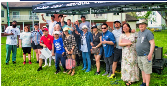
Fête des nouveaux voisins

TROIS ACTIVITÉS DE SENSIBILISATION avec la Maison des jeunes et l'école secondaire de l'Odyssee